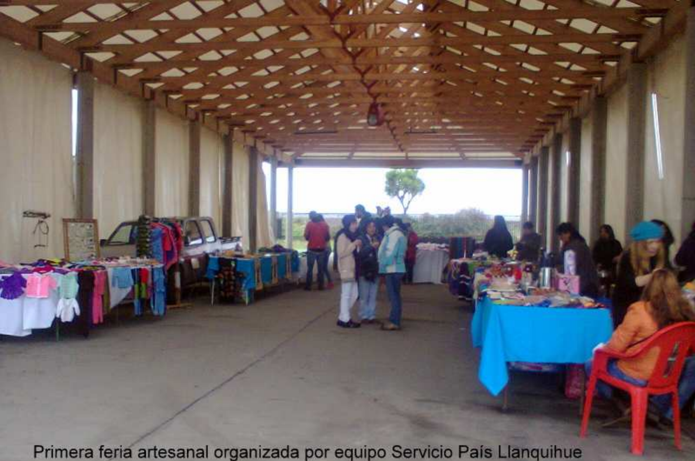
Primera feria artesanal organizada por equipo Servicio País Llanquihue