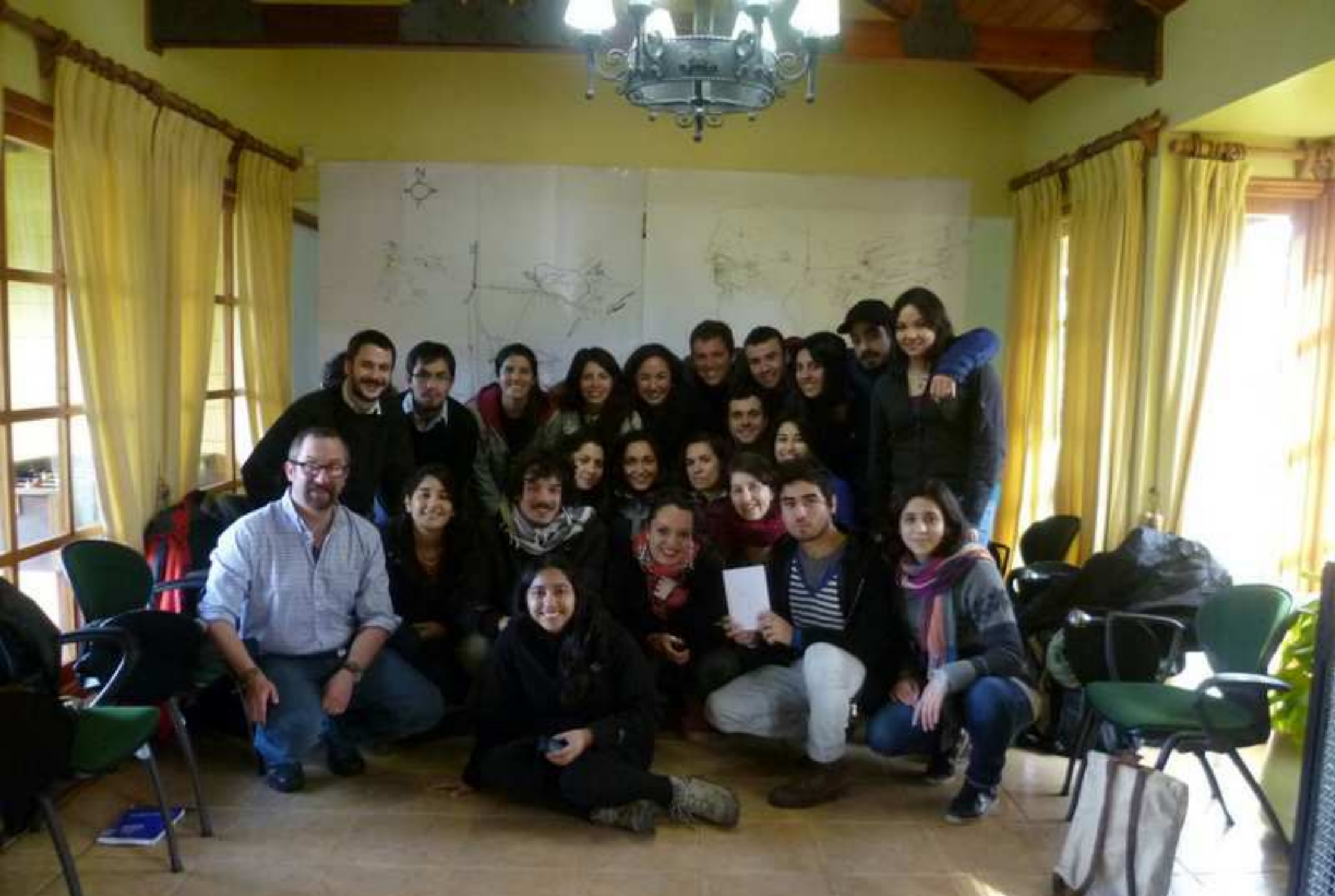
Jornada Regional Intermedia. Equipo Los Lagos primer día de trabajo.