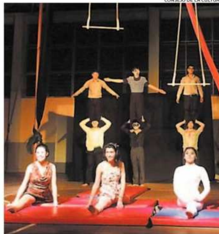
SE PRESENTÓ LA OBRA DE CIRCO TEATRO "LOS DEMÁS".

La iniciativa pretende generar plataformas de participación ciudadana en arte y cultura, donde profesionales de distintas áreas trabajan en esta desafiante tarea.