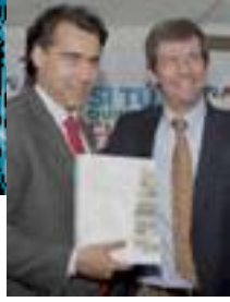
MARCO ENRÍQUEZ- OMINAMI

“(Es necesario) buscar una mirada distinta frente a la focalización que se hace hacia la pobreza, ya que esto puede estar llevando a que la gente esconda parte de sus ingresos o que actúe de cierta manera para obtener un puntaje menor en la Ficha de Protección Social. Esto puede traer graves consecuencias, pueden estar hipotecando su propio futuro (...) Hay chilenos que están viviendo en una condición que no es aceptable para el grado de desarrollo de nuestro país. Y además la diferencia entre los que más tienen y los que menos tienen tampoco es aceptable. Y si nosotros queremos un país en paz, y si queremos un país que progrese, y si queremos un país social, política y económicamente viable, esos son temas fundamentales”.